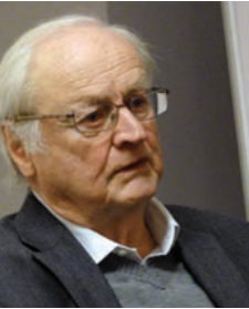
Arvid Carlsson