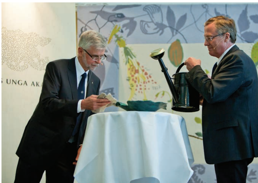
KVA planterar Sveriges unga akademi.