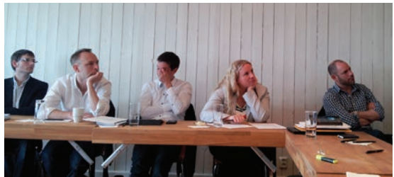
Akademimöte i Lund maj 2012