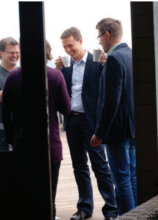
Ledamöter i samtal